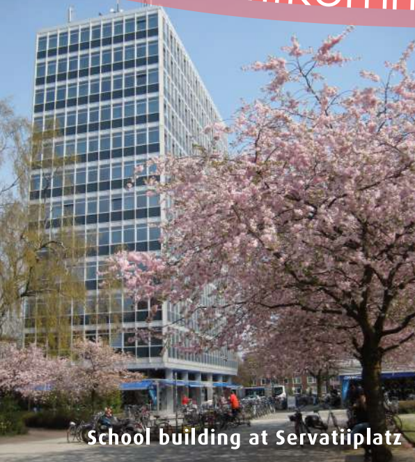
School building at Servatiiplatz

With more than 60,000 students, Münster is one of the largest university cities and one of the most popular places to study in Germany. Young people determine the rhythm of life in the city and create a special, lively atmosphere.